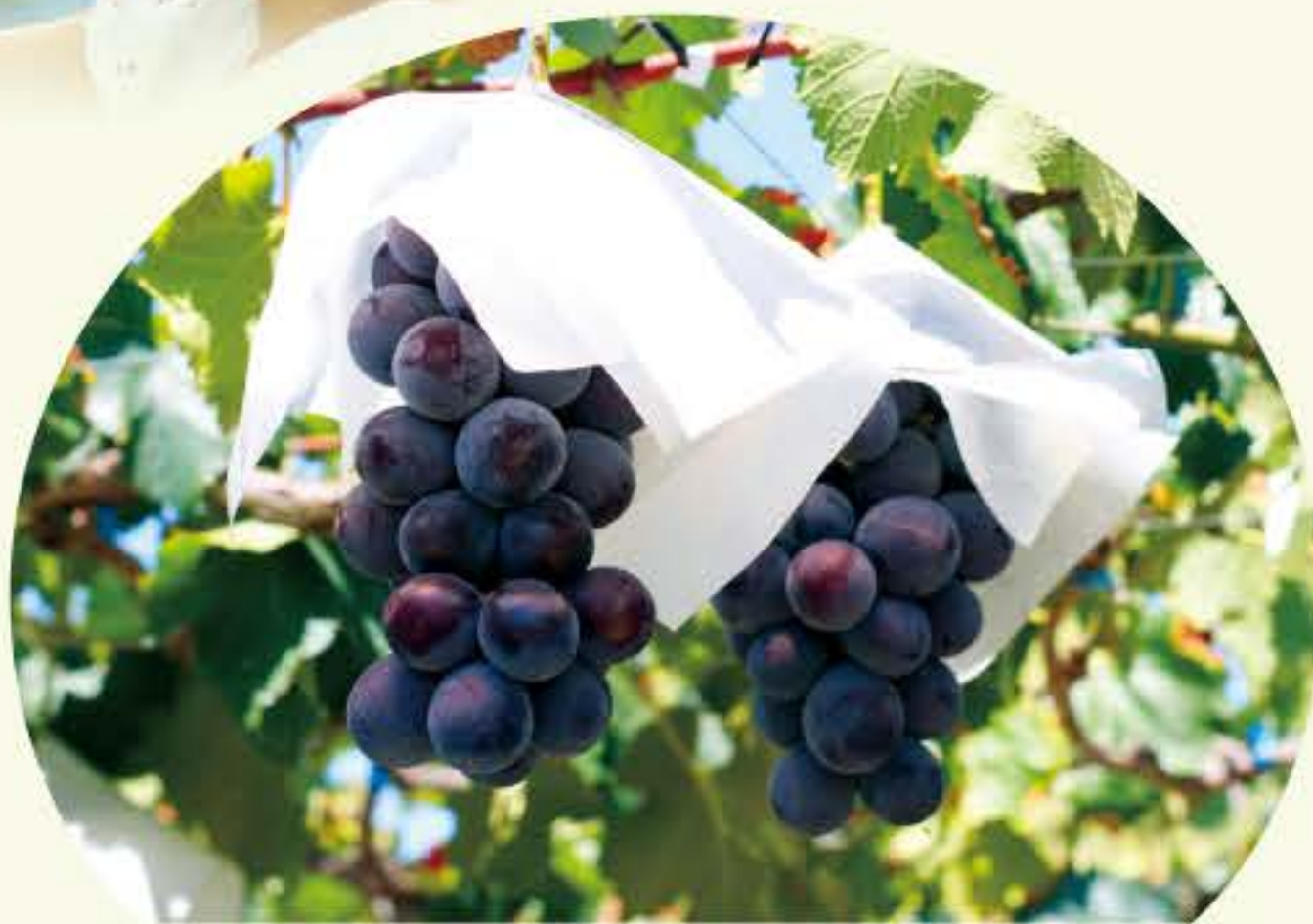
高級品種(巨峰系) (8月下旬～10月中旬)