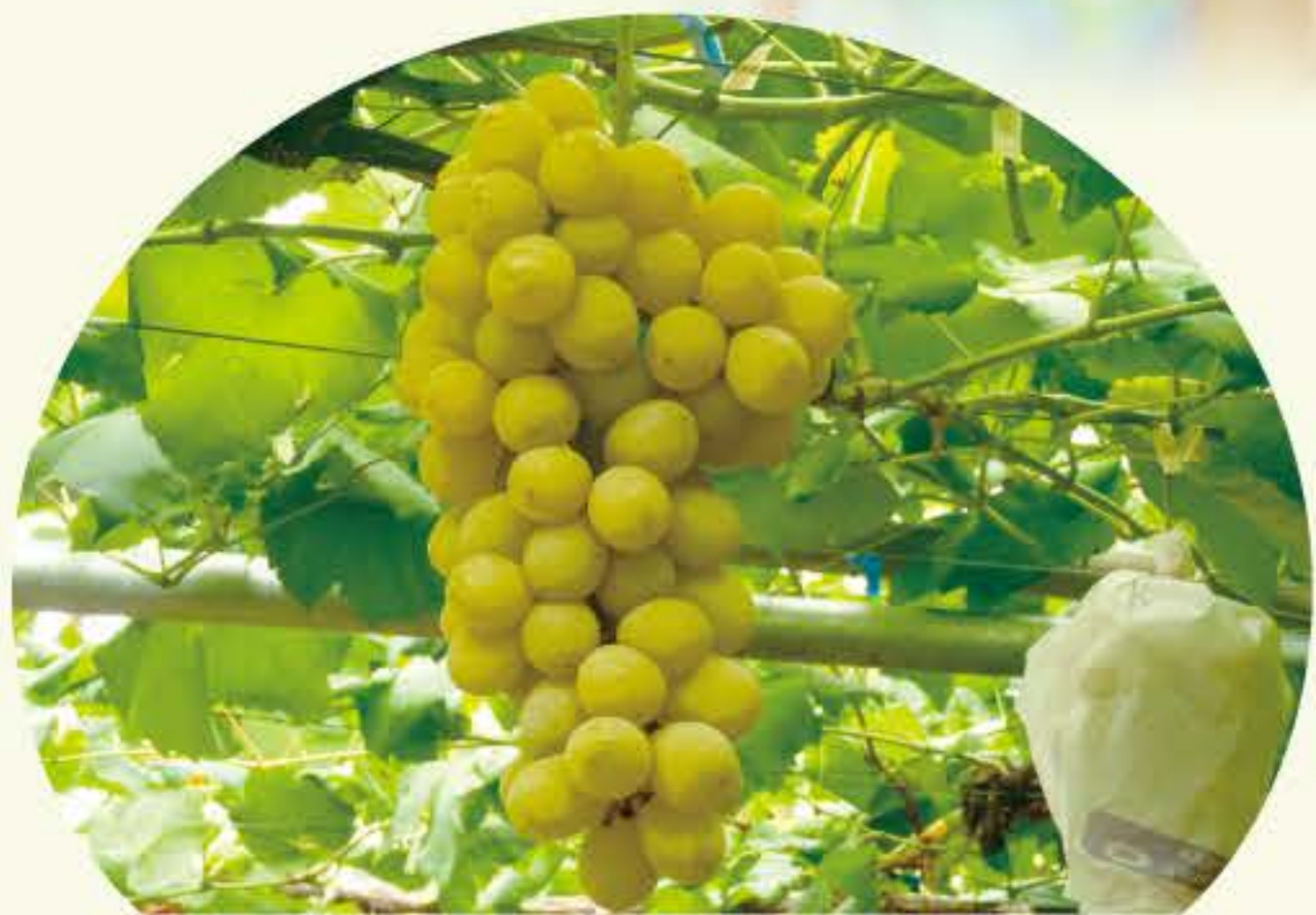
ヒムロット(早生系) (8月中旬～8月下旬)