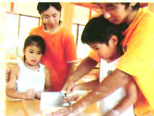
◀ そば・うどん打ち体験