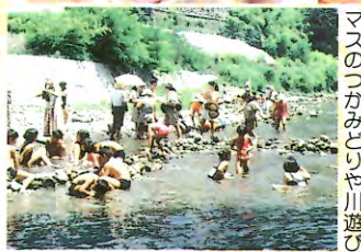
▶ 歩いて5分程の横瀬川で マスのつかみどりや川遊び